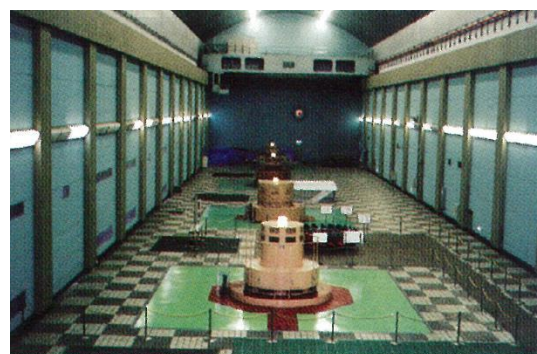
黒部川第四発電所