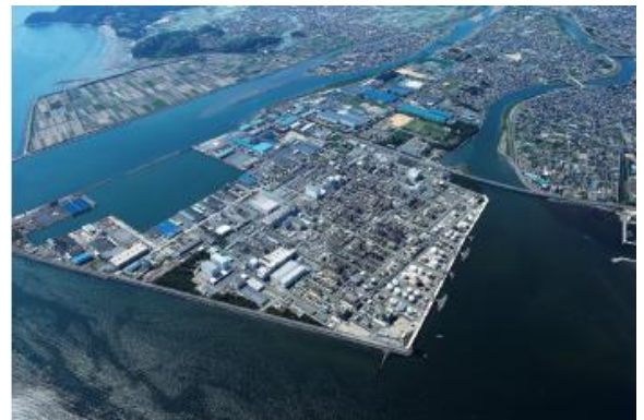
(株)日本触媒姫路製造所 全景