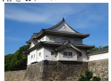
千貫櫓(せんがんやぐら)

TEL: 06-6441-0458 FAX:06-6443-4569 E-mail:science@isco.gr.jp