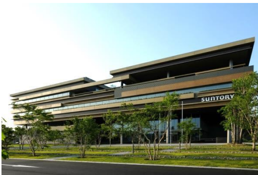
サントリー ワールド リサーチセンター 外観